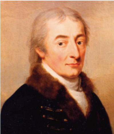
Festetics Imre, genetikus

használta a genetika kifejezést, felismerte az öröklés alapelveit, megfogalmazta a mutáció alapjait. Festetics Andor jogász, politikus, Pest-Pilis-Solt-Kiskun vármegye főjegyzője és Vas vármegyei birtokos volt. Alsószelestei birtokán növénykülönlegességből arborétumot is kialakított. A Wekerle- és a Bánffy-kormány földművelésügyi minisztereként irányította a Rába szabályozási munkáit, valamint a phylloxera elleni védekezést. Épített örökségükhöz tartozik többek között a simasági, bogáti és a már említett alsószelestei kastély. Festetics II. György a Sopron-Nagykanizsa közti vasútvonal megvalósításában vett részt. A neves család tagjai plébániákat, templomokat tartottak fenn, valamint több oktatási és kulturális intézmény működését is támogatták.