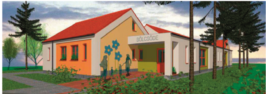
Gencsapáti bölcsőde látványterve

A Terület- és Településfejlesztési Operatív Program Plusz (TOP Plusz) sokszínűsége segítségével folyamatosan fejlődik Vas vármegye, keretében a következő időszakban jónéhány épület korszerűsödik, belterületi utak újulnak meg, valamint az iparterület- és turizmusfejlesztés is folytatódik.