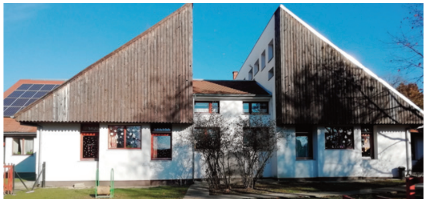
Óriszentpéteri óvoda, felújítás előtt

Épületek – óvoda, bölcsőde – korszerűsítésére kerül sor a közeljövőben a „Gyermeknevelést támogató humán infrastruktúra fejlesztése” konstrukcióban: