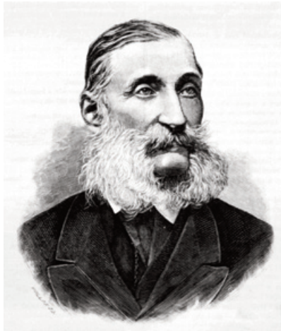
Festetics György, mezőgazdász