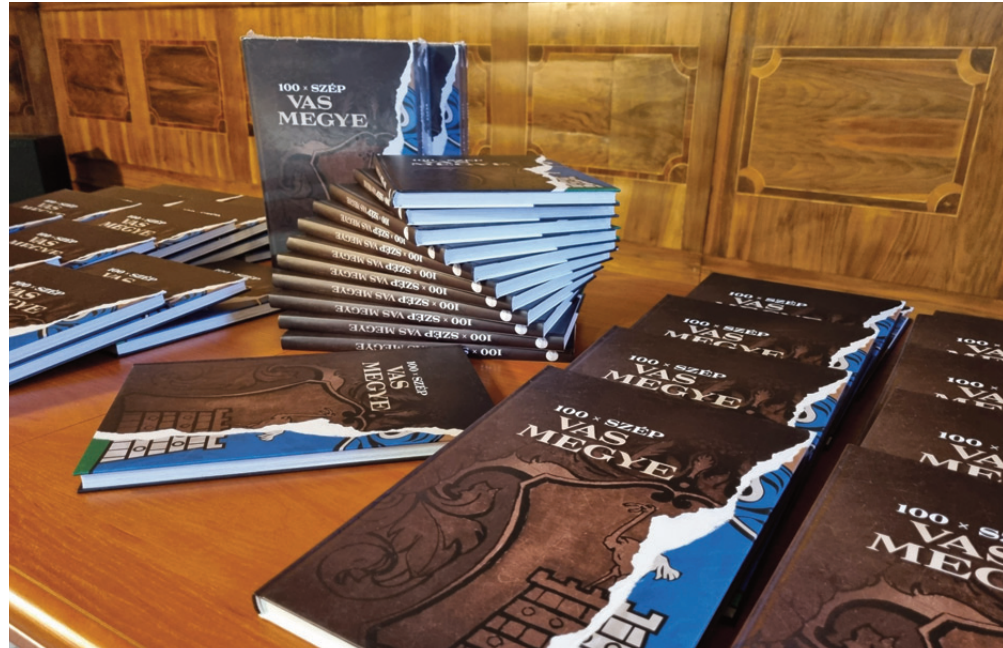
Szentgotthárd, 100XSZÉP VAS MEGYE könyv – könyvbemutató

részletesebben a „ Közös jövőnk: Vas vármegye ” közösségi központ ( https://www.facebook.com/ko-