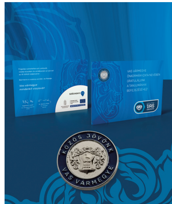
Vas Vármegye Visszavár üdvözlőlap kitűzővel, Vas vármegyei középiskolák végzős diákjainak ajándéka

zosjovonk) és Vas Vármegye Önkormányzata Facebook-oldalakon tájékozódhatnak.