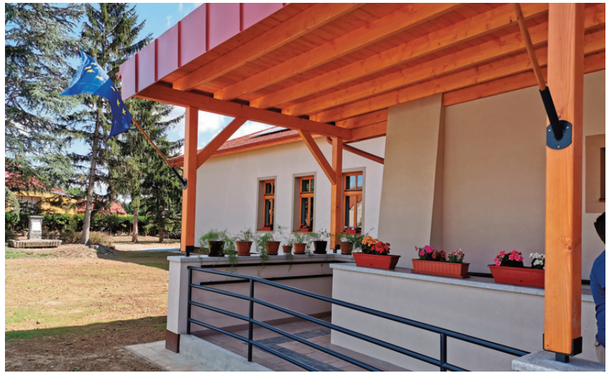
Művelődési ház, Lukácsháza

A Terület- és Településfejlesztési Operatív Program zárásához közeledve érdemes számba venni annak eredményeit. A TOP 243 projekttel járult hozzá Vas vármegye fejlődéséhez. A több mint 38 milliárd forint értékű fejlesztési forrás számos területen nyújtott pályázati lehetőségeket a települési önkormányzatok számára. A beruházások döntő többsége már megvalósult, néhány projekt esetében a kivitelezés az idei év során zárul le. A program keretében Bükön, Szentgotthárdon, Vasváron, Körmenden, Kőszegen és Celldömölkön történt iparterület-fejlesztés, összesen 170 hektárt meghaladó mértékben. Megújult piac várja a látogatókat Vasváron, Répcelakon, Celldömölkön és Körmenden, agrárlogisztikai központ épült Egyházashetyén.