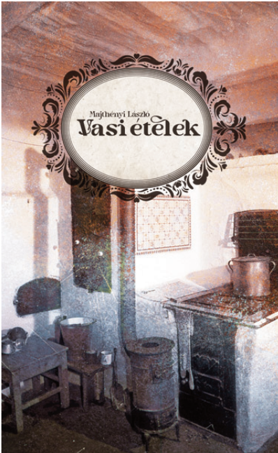
Vasi ételek könyv

látványterkép (falitérkép) Vas vármegyéről, amin az 50 kiemelt érték egyedi grafikája szerepel.