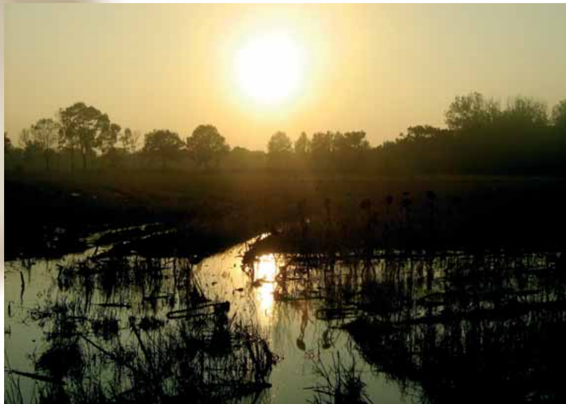
III. díj: Bokor Vera Zsófia: Répcesík